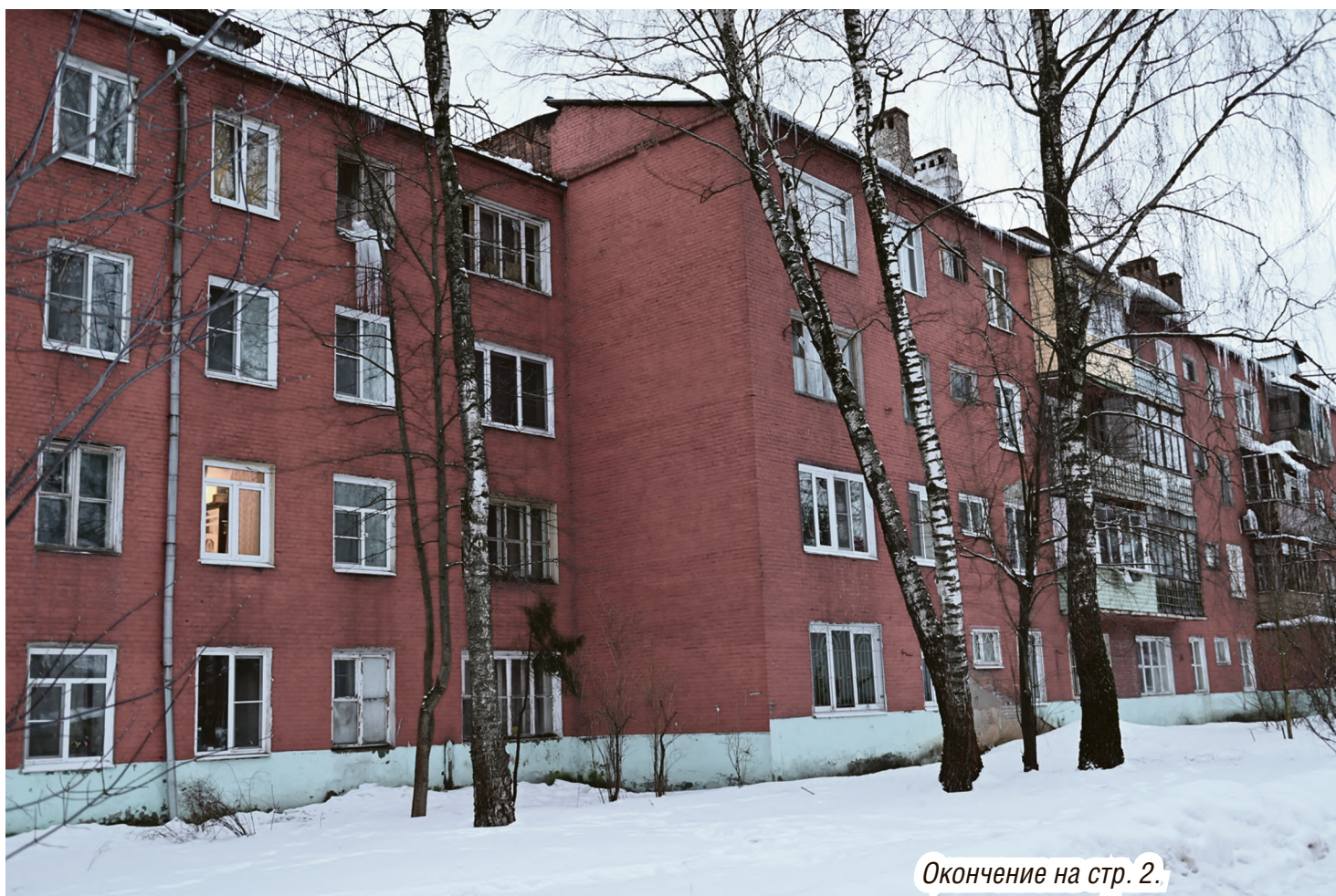
Окончение на стр. 2.

Как нам рассказали в администрации городского округа Коломна, по состоянию на 30 января поступило 21 заявление от граждан на выдачу жилищного сертификата с полным комплектом документов. Так, в Озёрах на улице Воровского, д. 33 из 20 помещений, которые находятся в собственности жителей, по двум поданы заявления, по шести – проводится проверка